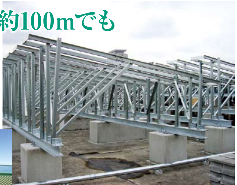
某自社高層ビル様 (東京都港区)